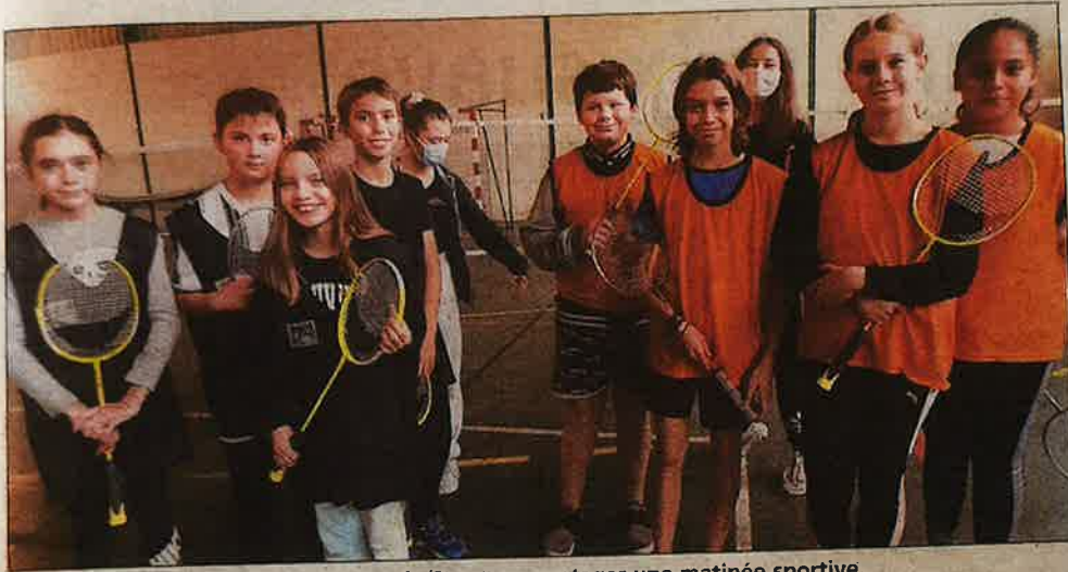
Tous les élèves de 6 e ont pu partager une matinée sportive.