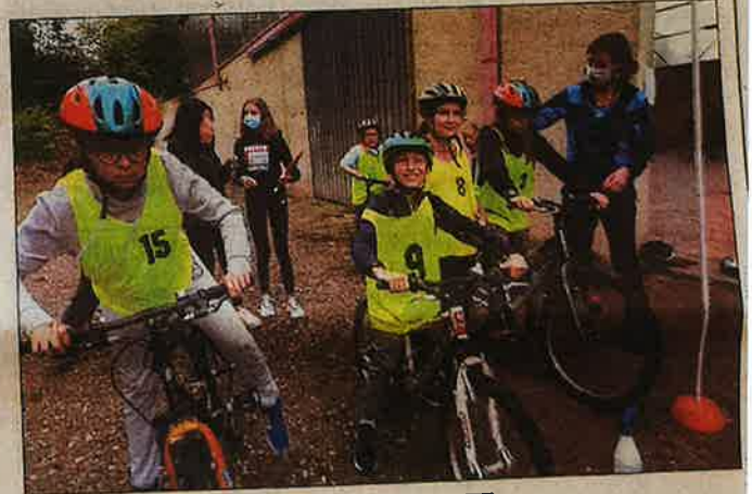
... ou encore du VTT.